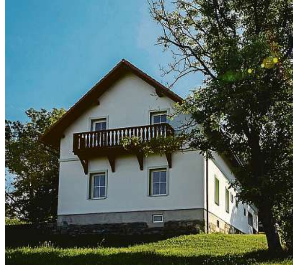
KRAJ VYBUDUJE VE SKOTNICI NOVOU SOCIÁLNÍ SLUŽBU.

Kraj v obci získal pozemek s vesnickým stavením, které pro potřeby domova zrekonstruuje a v jeho blízkosti postaví další dva nové objekty. „V těchto třech domcích bude místo pro dvanáct klientů, u kterých je předpoklad sociálního začle-