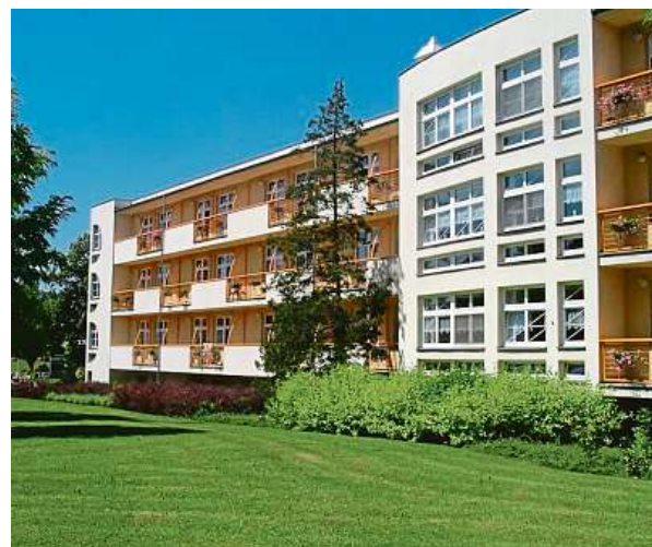
DOMOV SLUNÍČKO V OSTRAVĚ-VÍTKOVICÍCH.