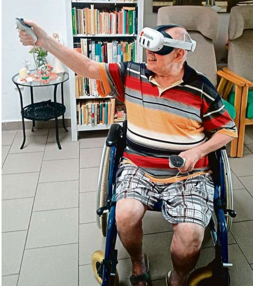
VIRTUÁLNÍ BRÝLE SENIOŘI VE TŘECH OSTRAVSKÝCH DOMOVECH UŽ VIRTUÁLNÍ REALITU DOBRĚ ZNAJÍ.

Vzhledem k pozitivnímu přínosu zapojení virtuální reality do denního programu seniorů město zvažuje rozšíření virtuálních programů i v dalších ostravských domovech pro seniory, a to v Domově Slunovrat a Domově Sluníčko.