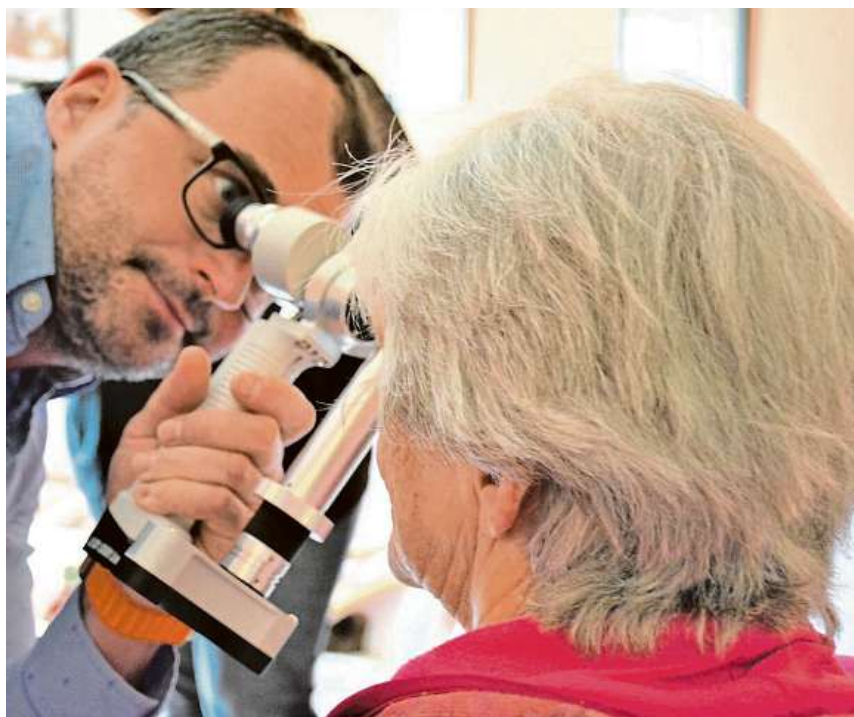
SOUČÁSTÍ PÉČE O KLIENTY VE VŠECH DOMOVECH ALZHEIMER HOME JE VYSOKÁ ÚROVEŇ ZDRAVOTNÍCH SLUŽEB.

Prostředků, které k tomu specializovaní pracovníci v domovech se zvláštním režimem používají, je přítom celá řada.