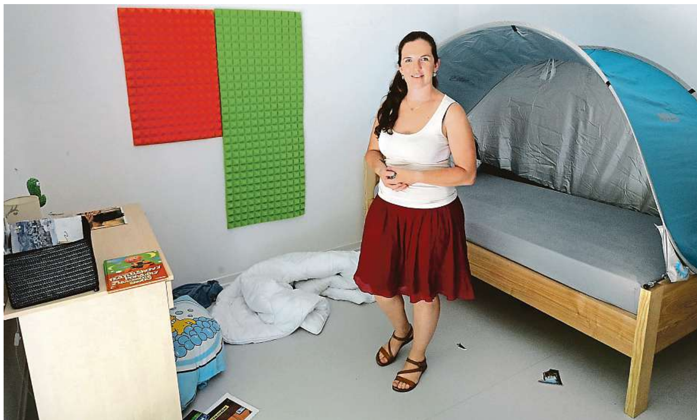
V DOMOVĚ IVANA MALCHAROVÁ V POKOJI JEDNOHO Z KLIENTŮ. KVŮLI BEZPEČNOSTI JE STROZE ZAŘÍZENÝ, VYBAVENÍ JE POKUD MOŽNO NEROZBITNÉ.

Sdružení Mikasa otevřelo v Ostravě první domov v kraji pro dospělé autisty s chováním náročným na péči. Zájem o něj je obrovský.