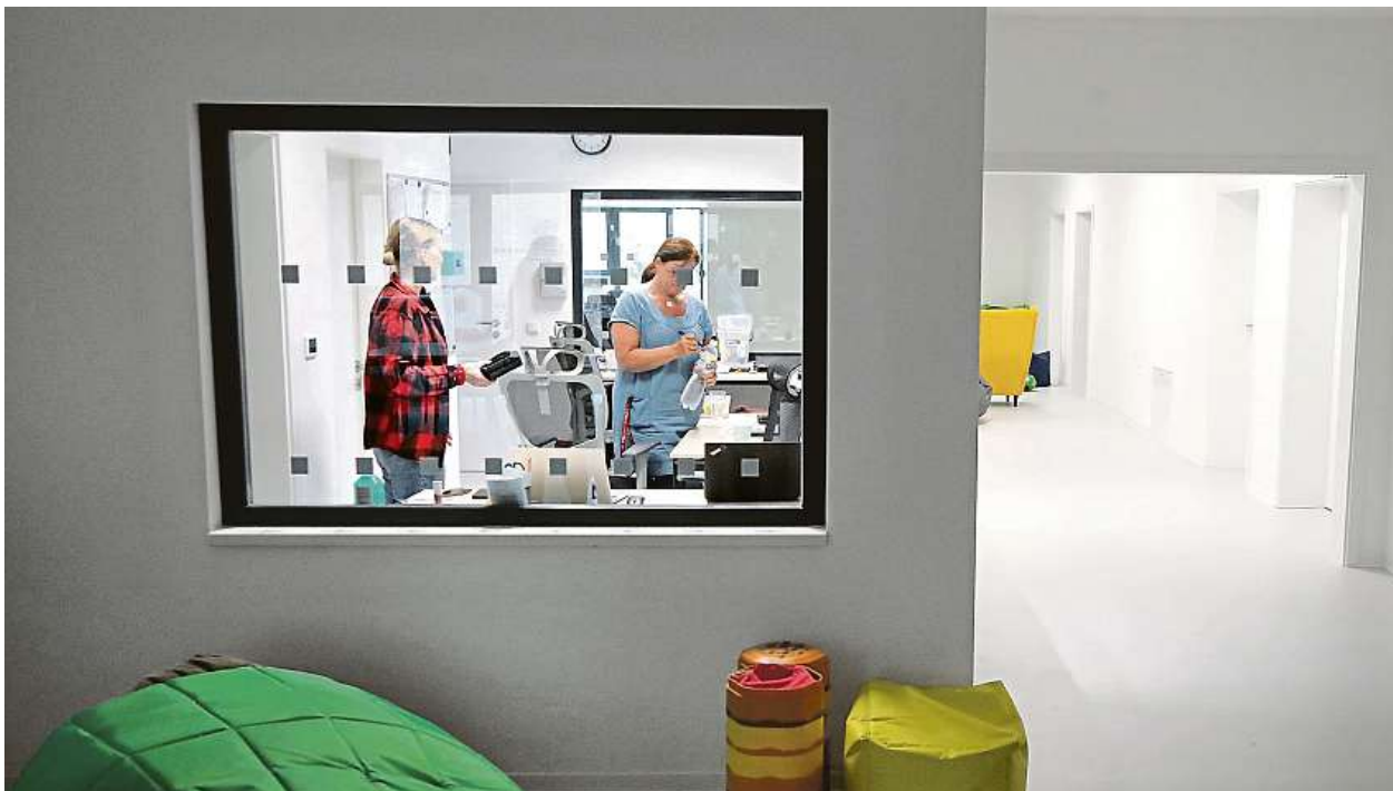
MÍSTO PRO PERSONÁL Z PROSKLENÉHO VELÍNA MÁ SLOUŽÍCÍ SMĚNA PŘEHLED O DĚNÍ VE SPOLEČNÝCH PROSTORECH DOMOVA.